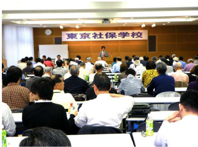
会場いっぱい参加者

道州制の問題で一番困難な課題を抱えていくところは実は首都圏なんです。道州制は今日の後期高齢者医療制度の行政的な中核に座っている広域行政、広域連合のあり方が、実は道州制へ踏み出していく大きなステップになっていて、住民や国民の意見を直接行政が受け止める体制を出来るだけ違う、