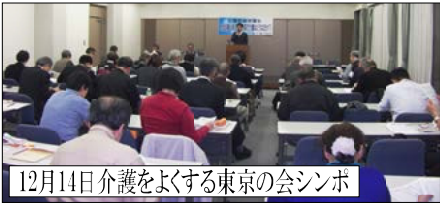
12月14日介護をよくする東京の会シンポ

国立社保協は国立市に、介護保険料の抑制をすることなど5項目の要望書を提出し、市の回答書と介護運営協議会の答申協議の終了を待って、1月18日、国立市と話し合いを持ちました。