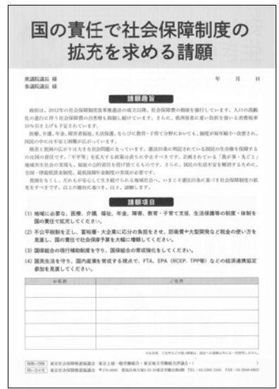
< 25条署名・見本 >